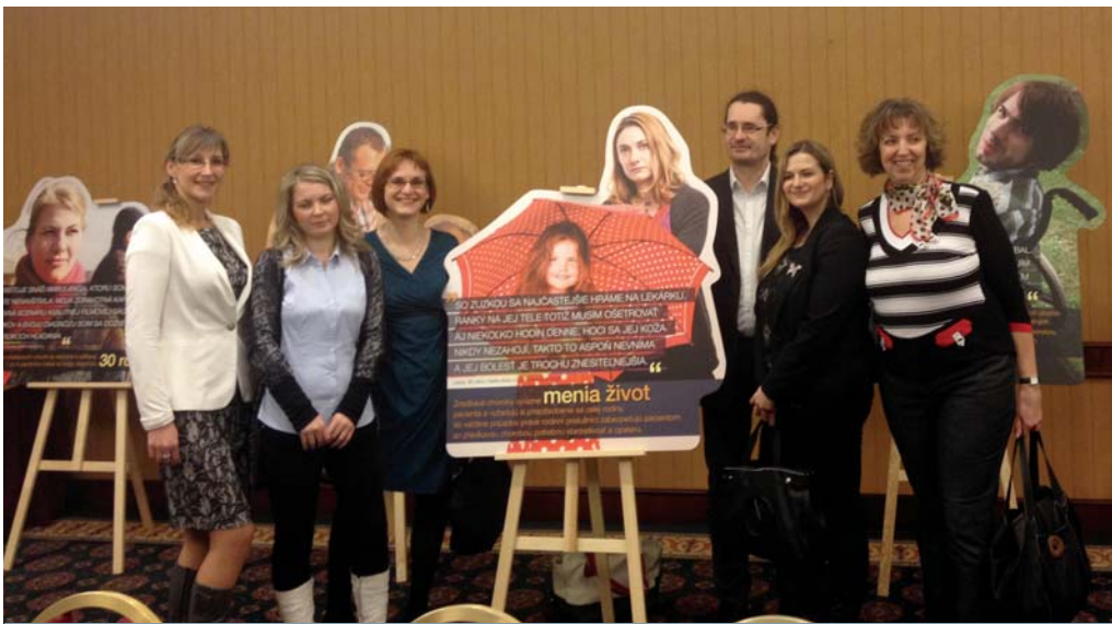
Tím Aliancie ZCH predstavil kampaň Dňa zriedkavých chorôb 2014 na tlačovej konferencii

„Zriedkavé choroby sú menej zriedkavé ako sa zdá. Na Slovensku nimi trpí približne 300 000 ľudí.“ Takto znie slogan tohtoročnej kampane Dňa zriedkavých chorôb 2014, ktorú na Slovensku organizuje Slovenská aliancia zriedkavých chorôb. Medzinárodný deň zriedkavých chorôb je relatívne mladým pripomienkovým dňom. V roku 2008 ho stanovila Svetová zdravotnícka organizácia na posledný februárový deň. Tento rok teda pripadol na 28. 2. 2014. Európska aliancia zriedkavých chorôb (EURORDIS) pri tejto príležitosti organizuje celoeurópsku kampaň. Slovensko sa vďaka Sloven-